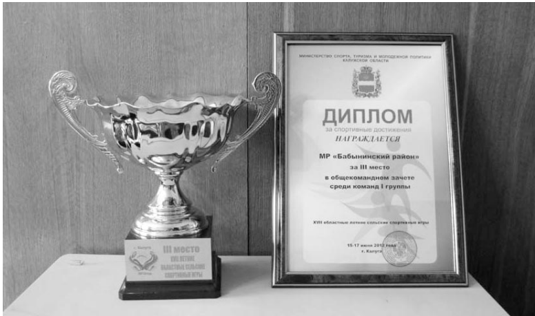
За третье место, занятое в 17-ых летних сельских спортивных играх, наш район награжден Кубком и Дипломом.